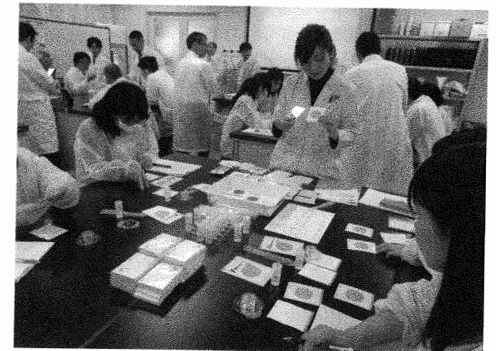
3Mの「ペトリフィルム™」シリーズを用いた実習の様子

実習の部では、検査資材・試薬をアクアシステム㈱、アヅマックス㈱、エア・ブラウン㈱、栄研化学㈱、㈱エルメックス、キッコーマンバイオケミファ㈱、スリーエム ジャパン㈱、大日本印刷㈱、東京サラヤ㈱、日水製薬㈱、ニッタ㈱が提供し、グループごとに講師の説明を受けながら ATP ふき取り検査やタンパク質検出キット、スマホで見る顕微鏡などを体験した。